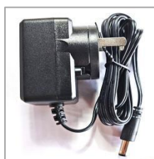
6V 适配器 W&T-AD1806A060030K (6V/0.3A)