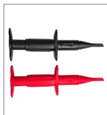
探头探钩 BP-368N (1000V/3A)